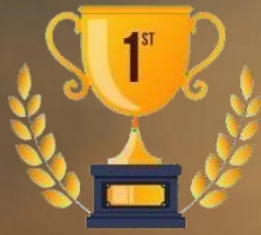
TRHOPY JUARA I

Perhitungan juara umum diambil dari akumulasi perolehan medali Emas.