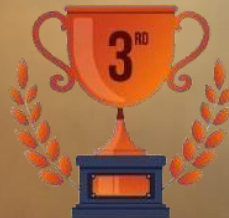
TRHOPY JUARA III