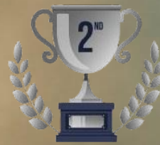
TRHOPY JUARA II